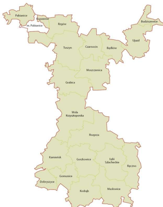
Mapa 1: Gminy członkowskie Stowarzyszenia Lokalna Grupa Działania „BUD-UJ RAZEM”

Gminy tworzące obszar LGD „BUD-UJ RAZEM” to: Będków, Budziszewice, Czarnocin, Dobryszce, Gomunice, Gorzkowice, Grabica, Masłowice, Moszczenica, Kamieńsk, Kodrąb, Ksawerów, Łęki Szlacheckie, Pabianice, Rozprza, Rzgów, Tuszyn, Ujazd, Wola Krzysztoporska, Ręczno (Mapa 1).