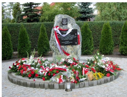
Miejsce pamięci. Gmina Ksawerów