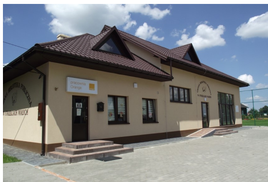
Gminna Biblioteka Publiczna w Strzelcach Małych

Koszty kwalifikowalne operacji nie są współfinansowane z innych środków publicznych (nie stosuje się do operacji realizowanych przez JSFP lub organizację OPP).