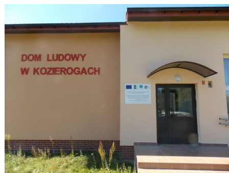
Dom Ludowy w Kozierogach