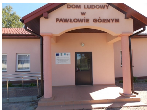
Dom Ludowy w Pawłowie Górnym