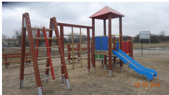
Plac zabaw w Chełmie

O pomoc nie może ubiegać się podmiot prowadzący działalność gospodarczą . Jedynym wyjątkiem jest przypadek Grantobiorcy, który zgodnie ze swoim statutem w ramach swojej struktury organizacyjnej powołał jednostki organizacyjne, takie jak sekcje lub koła – wówczas pomoc jest wypłacana nawet gdy: