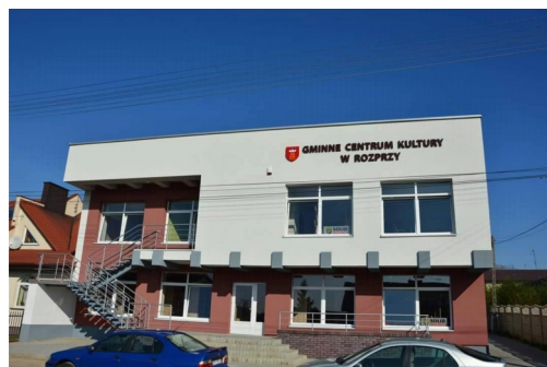
Gminne Centrum Kultury w Rozprzy