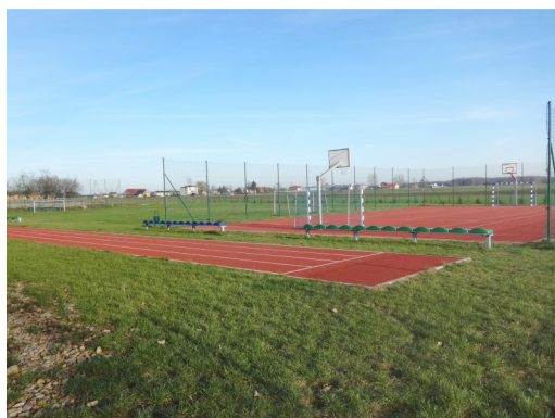
Kompleks sportowy w Woli Kamockiej

- Grantobiorca wykonuje działalność gospodarczą, jeżeli realizacja zadania, na które udzielany jest grant, nie jest związana z przedmiotem tej działalności, ale jest związana z przedmiotem działalności jednostki organizacyjnej Grantobiorcy.