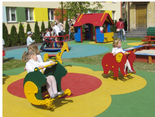
Plac zabaw w Gminie Ujazd