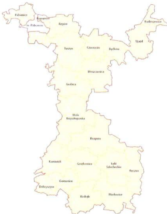
Mapa 1: Gminy członkowskie Stowarzyszenia Lokalna Grupa Działania „BUD-UJ RAZEM”

Gminy tworzące obszar LGD „BUD-UJ RAZEM” to: Będków, Budziszewice, Czarnocin, Dobryzycze, Gomunice, Gorzkowice, Grabica, Masłowice, Moszczenica, Kamieńsk, Kodrąb, Ksawerów, Łęki Szlacheckie, Pabianice, Rozprza, Rzgów, Tuszyn, Ujazd, Wola Krzysztoporska, Ręczno (Mapa 1).