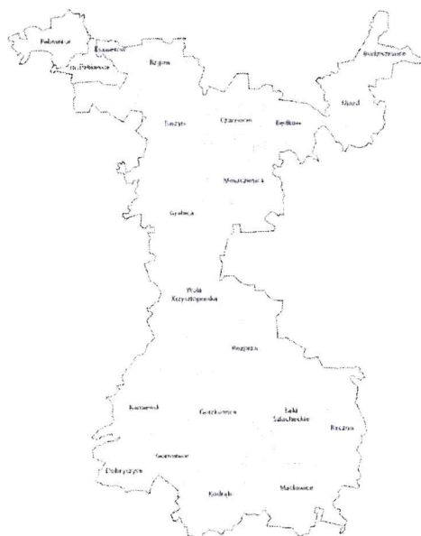
Mapa 1: Gminy członkowskie Stowarzyszenia Lokalna Grupa Działania „BUD-UJ RAZEM”

Gminy tworzące obszar LGD „BUD-UJ RAZEM” to: Będków, Budziszewice, Czarnocin, Dobryzycy, Gomunice, Gorzkowice, Grabica, Masłowice, Moszczenica, Kamieńsk, Kodrąb, Ksawerów, Łęki Szlacheckie, Pabianice, Rozprza, Rzgów, Tuszyn, Ujazd, Wola Krzysztoporska, Ręczno (Mapa 1).